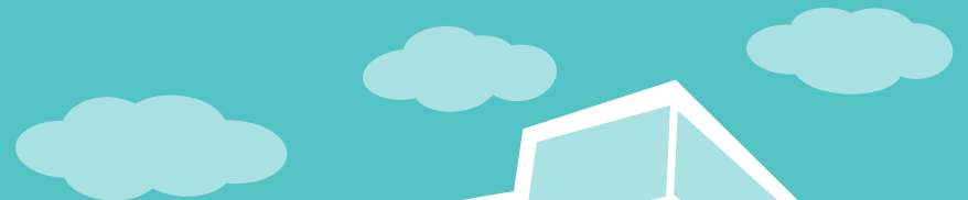
GRAND ORKAN 0